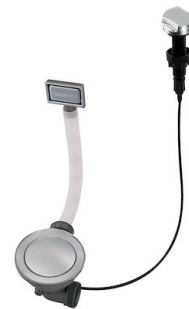
自动下水器 Space - PE 8407 109